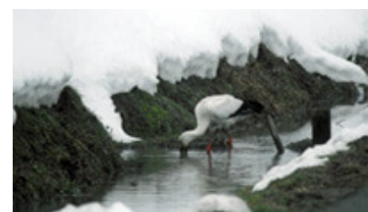
線路近くの水路に姿を現したコウノトリ