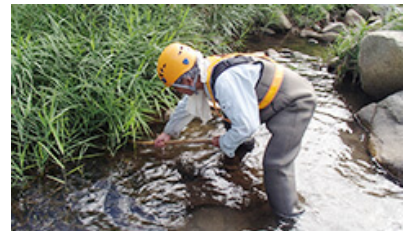
生物多様性の取り組み 生物調査

鳥取県石見川流域では、特別天然記念物オオサンショウウオの生息が確認されていたため、その水系に近い伯備線の護岸工事に際し、生息調査を実施し、確認・保護した4体を上流に放流した上で工事に着工しました。